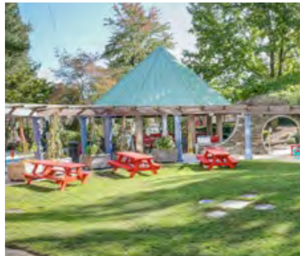
Jardín Balise Healing

La casa ofrece un lugar sin estrés para que las familias se alejen un poco del hospital, coman algo y compartan una red de apoyo sin igual con otras familias, el personal y los amables voluntarios. La estadía en la casa Ronald McDonald es gratuita. Para obtener más información, hable con su trabajador social en el hospital, o llame directamente a la casa Ronald McDonald de Providence al 401-274-4447.