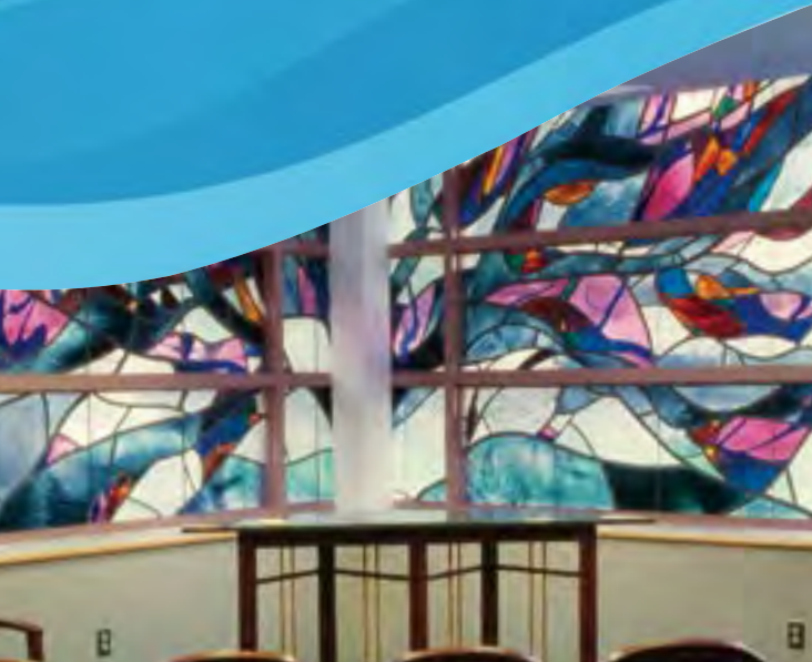
Capilla de Hasbro Children's