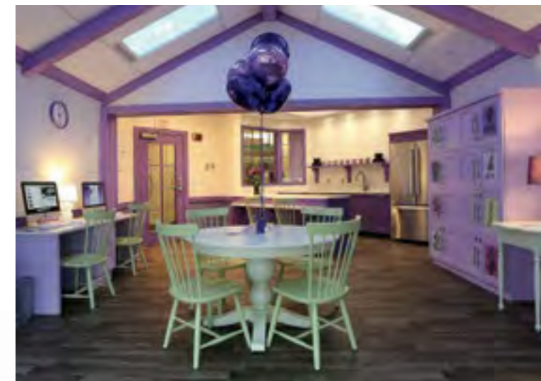
La sala familiar Izzy

La sala familiar Izzy está ubicada en el 5.º piso. Se trata de un espacio familiar tanto para los padres/cuidadores como para los pacientes. La Fundación Izzy ofrece refrigerios, café, artículos de higiene y comidas la mayoría de los días. Está equipada con una cocina, microondas, computadoras, televisión y cómodos asientos. Para su comodidad, el espacio está abierto las 24 horas del día. Solicite el código de acceso a la secretaria de la unidad.